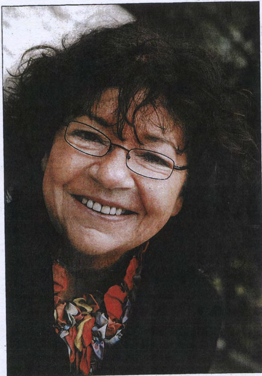
«Jamais je n'ai eu honte de m'être prostituée. C'est à eux d'avoir honte.»

Je voulais leur dire: vous n'êtes pas des bêtes sauvages. Quoi que vous ayez fait, on peut vous aimer vous aussi. Lorsque je les ai rencontrés, c'était ma vie qui les intéressait, pas le bouquin. Ayant été prostituée, je faisais un peu partie des leurs.